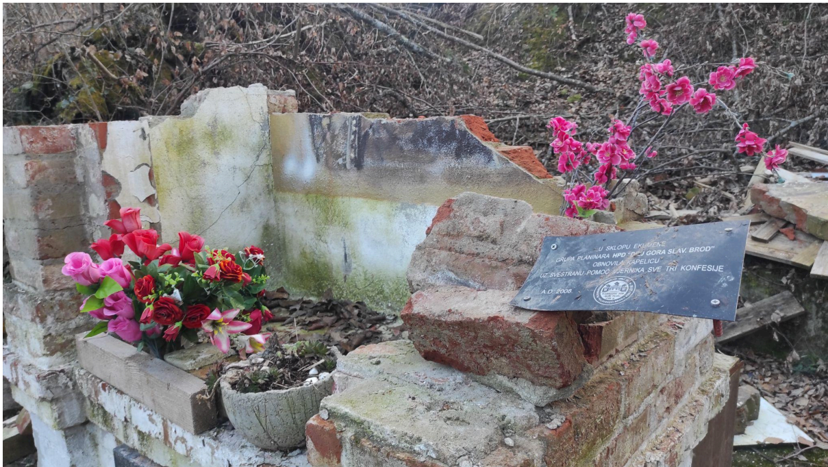
Ploča na ruševinama kapelice na kojoj je vidljivo da je grupa planinara obnovila kapelicu uz svestranu pomoć vjernika sve tri konfesije