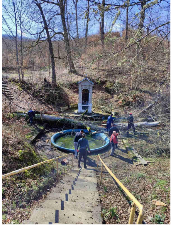
Radne akcije planinara u ožujku 2023.