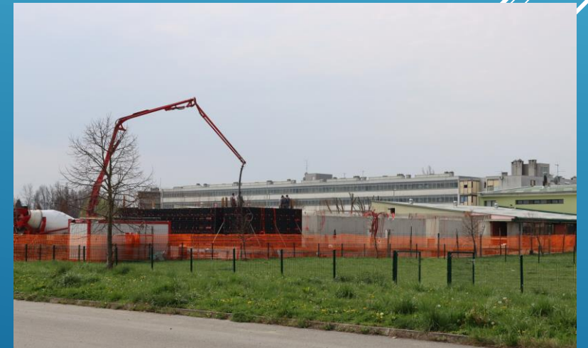
Proširenje vrtića Hlapić