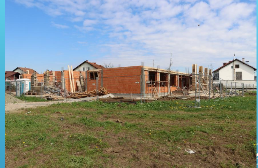
DV Toporko, Kolonija