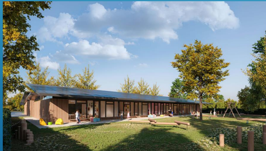
DV Svarožić, Livada