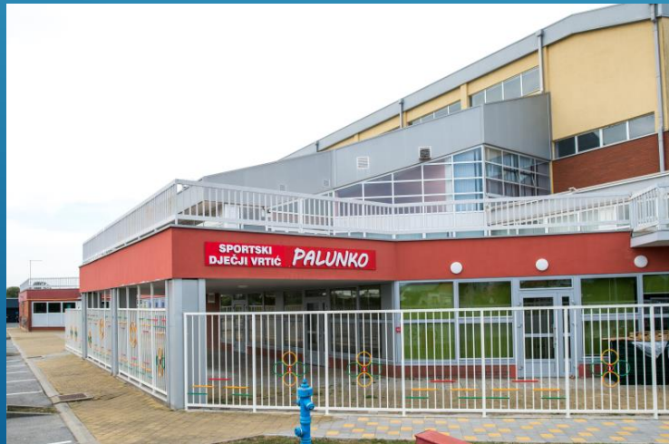
Proširenje vrtića Palunko