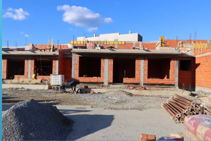
DV Rutvica, Jelas